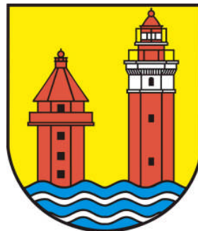
Das Dahmer Wappen

Neben dem Leuchtturm wurde 1939, als Ausguck, ein kleinerer Backsteinturm errichtet. So wurden die Sichtverhältnisse überwacht. Bei Regen, Nebel oder Schnee kam dann das Nebelhorn zum Einsatz und raubte den Einwohnern nachts ihren Schlaf, weil das Signal so laut war.